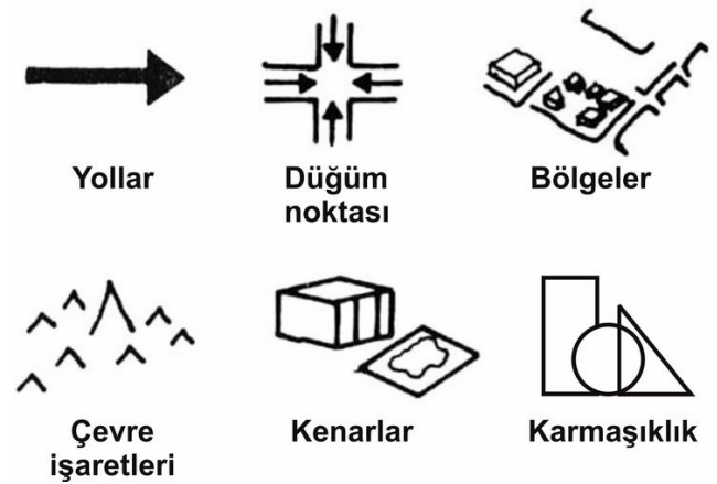
Şekil 1. Kentsel mekanın okunabilirlik bileşenleri

Lynch'e göre kentin okunabilirliğini beş elemanın özelliklerinin anlaşılması etkilemektedir: yollar, düğüm noktaları, bölgeler, çevre işaretleri ve kenarlar. Ancak bu sınıflama kentsel mekandaki elemanları içermez, bu nedenle burada kentin yapısal elemanları olan binaların kendi özelliklerinin değişkeni olarak karmaşıklık kavramını eklemek gerekmektedir (Şekil 1).