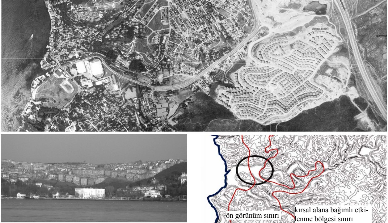
Şekil 1. Kavacık'ta topografyayı bozan yerleşimler

Bu kararlar Boğaziçi'ndeki eski eser tescili taleplerinde ve restorasyon uygulamalarında büyük bir artışa neden olmuştur. Eski eser tescili olmayan binaların yıkıldıkları an yeşil alan statüsü kazanmaları nedeniyle, özellikle öngörünüm bölgesindeki sıradan harap ahşap evler bile restorasyon ve inşaat izni alabilmek amacıyla eski eser olarak tescil ettirilmeye başlanmıştır. Üzerinde bina bulunmayan parsellerde eski eser bulunduğu eski fotoğraf ve belgelerle kanıtlanmaya çalışılarak restitüsyona dayalı restorasyonlarının yapılabilmesi için koruma kurullarına çok sayıda başvuru olmuştur. Yeni yapılaşmanın sınırlandırılmış olması olumlu bir karar olmakla birlikte, restorasyon uygulamalarına bakıldığında, bu dönemde restitüsyon adı altında, hiç var olmamış binaların rekonstrüksiyonun yapılarak yeni "eski"lerin inşa edilmiş olmasının koruma kuramı açısından çok da doğru sonuçlar verdiği söylenemez. Özellikle spekülasyona çok açık ve m 2 'ye aç bir psikolojik yağma ortamında restorasyon ve restitüsyon önerileri çoğu kez kabul edilebilecek nitelikte olmamıştır.