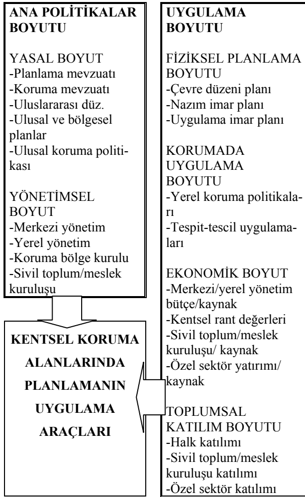
Şekil 2. Kentsel koruma alanlarında planlama sürecinin uygulama araçları