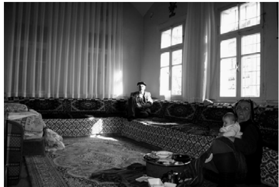
Şekil 11. Sekilik-sedirde oturma, fıırıncılar evi, Germir