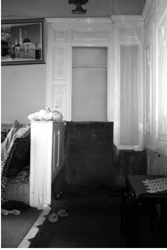
Şekil 12. Seki altında pabuçluk, Germir

Seki altı eşiklikte ayakkabıların çıkarıldığı nişler vardır; eşiklikte bu nişler “pabuçluk”tur (Şekil 12). Pabuçluk nişindeki şeyleri sekiden ayıran eşikliğin sekiden altta olmasındadır. Nişlerde duran ayakkabılar, seki basamaklarından ayrıdır. Orada ayakkabıların yerindeliği pabuçluk nişlerinde olmasında ve ayakkabılarla sekiye çıkılmamasındadır. Seki altı eşikliklikler seki önleridir. Sekialtının sekiliğin önündeliğini, sekide üç taraftan çevrili sedirlerde sekialtına doğru oturma sağlar. Sekialtı sekiliğin ve kapının önündedir. Sekialtının sofa ve seki arasındalığı, sofadan kapıyla, sekiden basamakla yaklaşmayı bir birinden ayırmasında ve bir araya getirmesindedir. Sekide sedirde oturma, önünde seki-altı duvarındaki şerbetlik nişine yönelir (Şekil 13).