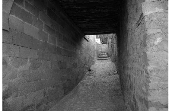
Şekil 5. Kabaltı, Ali Saib Paşa Sokağı, Talas

oda, kabaltı oda-altıdır. Bu oda altının altındalığı aşağı/yukarı, iç/dış, alt/üst, orada/burada, ön/arka katlanmalarını bir mekanzamansal süreklilik olarak açığa çıkarır. Sokağı örten, çocukların gölgesinde kümelendiği bir serinleme arasıdır kabaltı... Evin altının buraya düşürdüğü derin gölge, kabaltının ağzından içeri sokulan ışık ile gün boyunca değişen ışıklı ve gölgeli yüzeyleri oluşturur. Kabaltında ev sokakla bütünleşir, bu defa evler sokağı yeryüzüne nispet gökyüzünde paylaşmaktadır. Kabın altında olanı sokağın üstünde olanla buluşturan “kab”, arada olandır.