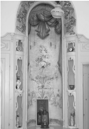
Şekil 13. Şerbetlik nişi, Germir

Evlerde nişler duvarlarda yerindedir. Nişler şeylerin yeri olarak kendileri de bir yerdir. Her duvar nişinin adı ayrıdır; adlarını kullanımlarından alır: Yüklük, çubukluk, kavukluk, testilik, öteklük, fincanlık, peşkirlik, lambalık, tembel deliği. Yüklük nişi gündüzleri uyuma eylemini barındırır.