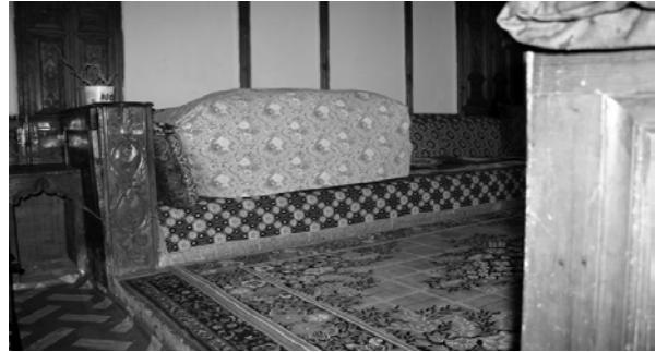
Şekil 10. Seki altı-sekilik, fıırıncılar evi, Germir

Sekiye seki altından ayıran basamaklar ve ahşap korkuluklardır. Seki altı sert bir dokunuşa, ayak-kabıllara aittir; seki ahşabın gıcirtısını tattıran bir yumuşaklıkta, ayağa... Sekinin ahşap yumuşaklığında pencerelerinin önünde sedirler durur (Şekil 11). Sedirler sekinin yumuşaklığını pencere önünde oturmaya taşımaktadır. Sedirler sekiyle birlikte üsttedir. Sekinin sürekliliğinde sedirlerde oturulmasını kilimler, halılar, minderler, yastıklar sağlar.