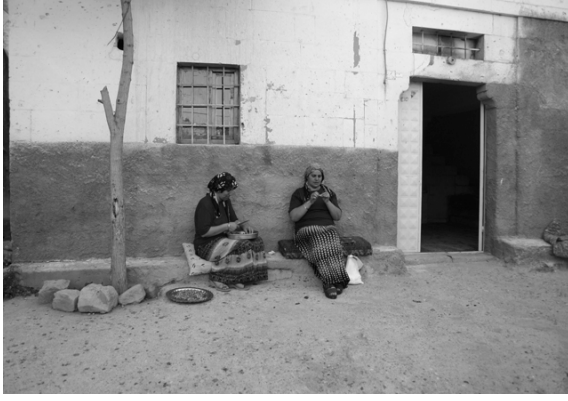
Şekil 8. Evlerinin önünde kadınlar el işi ve yemek hazırlığı yaparken, Talas, 2005

Evlerinin önü, avluda olmanın anlatısıdır. Sedirlerde, kilimlerde, kuyu başlarında, ağaç altında, köşkte oturmanın, ocak başında yemek pişirmenin, avluda oluşturduğu köşelerin varlığıdır avluları “hayat” yapan. Hayat çoğunlukla evlerinin avlusunda geçtiği için avlu “hayat” adındadır. Birbirlerine yaklaşan Anadolu evlerinin önünde hayat vardır: Evlerinin önü “hayat”ın-içinde-olmanın anlatısıdır. Gökyüzüne açık olan hayat dünyasal aktivitelerin geçtiği aralarla, merdiven basamaklarının, bir ocağın, bir kuyunun, bir ağacın, bir çeşmenin, bir havuzun, bir sedirin etrafında kurulan dünya ile katların katlandığı bir aradır. Bu durumuyla hayat, birçok önün birbirine katlandığı konumlandırmaları barındıran önlerdeki karşılaşmalardır.