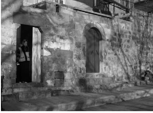
Şekil 3. Kapı aralığı, Reşadiye, 2005

düşen güneşi sevmiştir. Renklilik rengarenk giyinen Anadolu kadının giysilerinde, diktiği çiçeklerde, ağaçlarda çeşitlenir. Aralanan kapılardan düşen renk, aynı taşların arasında hareketlenmektedir (Şekil 3).