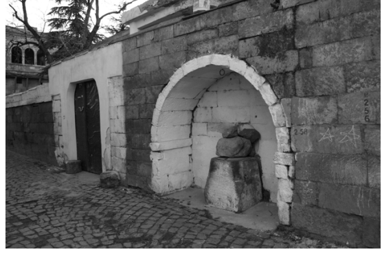
Şekil 1. Evlerinin önünde kuyu

Gündelik yaşamda bir ağacın, bir çeşmenin, bir merdivenin, bir nişin, bir kuyunun, bir basamağın etrafında bir dünya kurulur. Birçok gündelik eylem gece ve gündüzün, mevsimlerin, saatlerin geçişiyle “evlerinin önü”nde geçmektedir. Öünüdelikler vardır burada, yaşamdaki etkileşimlerin özelliklerine göre değişen. Bazen tüm bir sokak, bazen bir kapı eşiği, bazen bir pencere, bazen bir kuyu, bazen duvardaki bir delik, bazen de tek bir taş parçası “evlerinin önü”nü oluşturur (Şekil 1, Şekil 2). Bir öünüdelik, diğer bir öünüdeliğe sürekli olarak açılmaktadır.