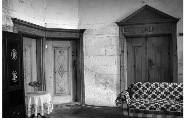
Şekil 9. Fırıncılar evi sofası, Germir

Evlerinin sofasına açılan odaların içeri çağırın kapı eşikleri seki altlarıdır (Şekil 10). Seki altları kapı eşikinde taşlık köşeleridir. Bu araların adı “eşiklik”tir. Eşiklik orada alttadır. Eşikliği seki altı yapan, oturma köşesine iki ya da üç ayakla çıkılan sekinin kendisidir.