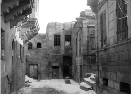
Şekil 4. Gazi Çıkmazı, Kayseri, 2007

Aynı taşlar arasındaki yolculuk bazen bir evle karşılaşır. Sokağın sonundaki bu evin önünde çıkmazlar vardır. Çıkmaz sokakların başka sokaklara çıkmazlığı sokakta yürüme eylemini kesintiye uğratmaya yetmez. Bu defa ev sokağın sürekliliğini sağlamaktadır. (Şekil 4). Evlerinin önünde bu çıkmazlar sokağın başlangıç ve bitişlerini bir araya getirir.