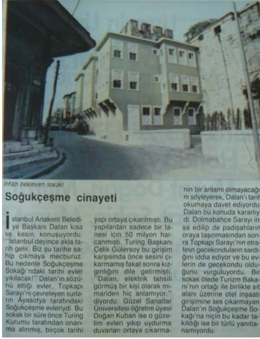
Şekil 5. Nokta, 1986

Seksenlerde hem devlet baskısının hem de ekonomik dönüşümün neden olduğu ve uzun yıllar kamusal alanda konuşulmadan kalan acıların ve kayıpların işareti olabilecek nostaljik ürünler, belirli kesimlere bir aidiyet şekli sunmaktadır. Dolayısıyla nostalji, geçmişle ilgili çeşitli hatırlama ve anlamlandırma ihtiyaçlarını paketleyerek, anlamları “çalarak” ve çoğu zaman bunları acısızlaştırarak piyasaya sürer. Nostaljik ürünler kaybedilen geçmişi hatırlatmaya devam edecektir. Bu anlamıyla geçmişten kurtulmak mümkün değil (Ahıska ve Yenal, 2006).