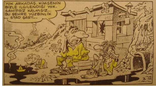
Şekil 3. Gırgır, 1988.

Diğer küresel kentlerden farklı olarak, İstanbul her zaman bir dünya başkenti olmuştur: Bin beş yüzyıldan fazla imparatorluk başkenti olan bu şehrin efsanevi görkemini, önce Avrupa, ardından da Balkanlar ve Ortadoğu haset dolu gözlerle izlemiştir (Keyder, 2000).