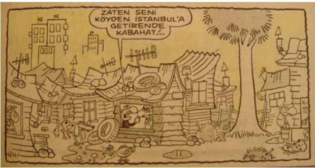
Şekil 1. Gırgır, 1987

Genellikle kentlilik / köylülük, modernlik / geleneksellik, Batılılık / Doğululuk, zenginlik / yoksulluk, gelişmişlik / geri kalmışlık barınma pratikleri, kentteki toplumsal ve kültürel hiyerarşileri oluşturmada ve yansıtmada, insanların davranışlarını şekillendirmektedir (Şekil 1).