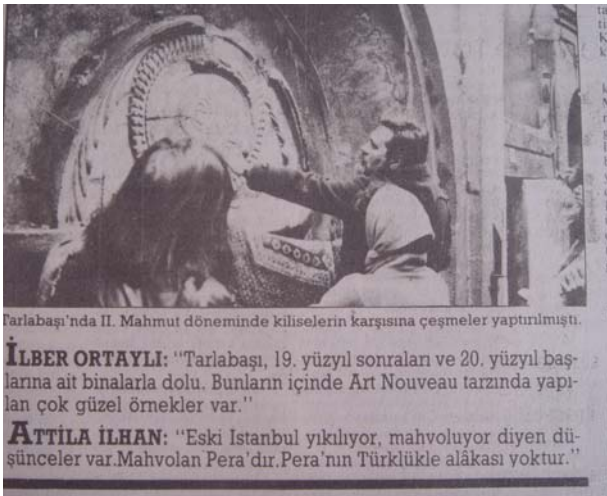
Şekil 6. Cumhuriyet, 1987

Seksenlerde hem devlet baskısının hem de ekonomik dönüşümün neden olduğu ve uzun yıllar kamusal alanda konuşulmadan kalan acıların ve kayıpların işareti olabilecek nostaljik ürünler, belirli kesimlere bir aidiyet şekli sunmaktadır. Dolayısıyla nostalji, geçmişle ilgili çeşitli hatırlama ve anlamlandırma ihtiyaçlarını paketleyerek, anlamları “çalarak” ve çoğu zaman bunları acısızlaştırarak piyasaya sürer. Nostaljik ürünler kaybedilen geçmişi hatırlatmaya devam edecektir. Bu anlamıyla geçmişten kurtulmak mümkün değil (Ahıska ve Yenal, 2006).