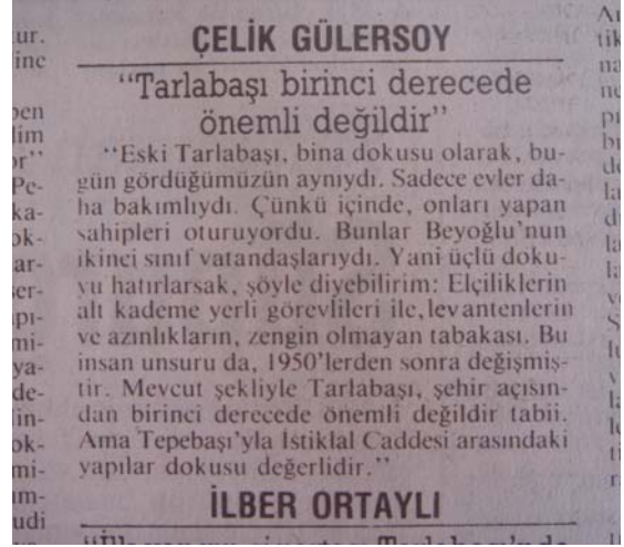
Şekil 7. Cumhuriyet, 1987