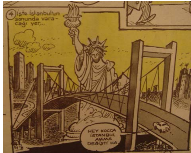
Şekil 4. Gırgır, 1988

Globalleşme, kentler arasındaki rekabeti hızlandırmış ve kentlere yepyeni ekonomik, politik ve kültürel roller yüklemiştir. Global sermayeye gereksindiği türde hizmetleri sunabilen global kentler ya da dünya kentleri, hızla yükselirken, bu sürecin dışında kalan kentler de dışlanmaktadır (Işık, 1995).