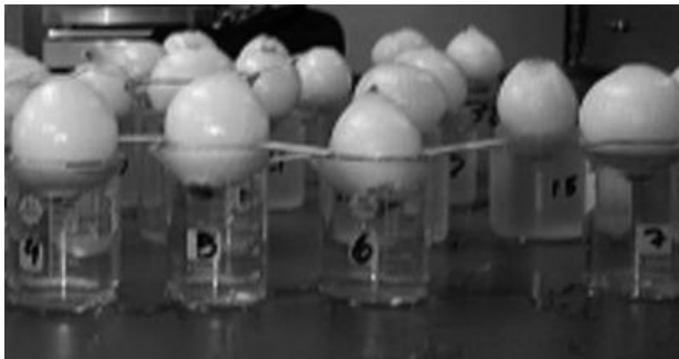
Imagen 1. Allium cepa test: Siembra de bulbos de la familia Amaryllidaceae.

Se sembraron bulbos de 5 cm de diámetro de la familia Amaryllidaceae como se observa en la Imagen 1.