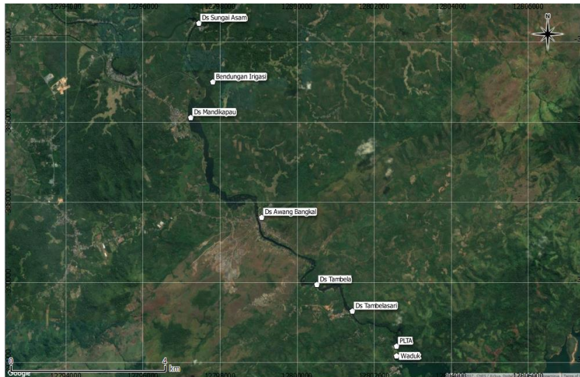
Gambar 1. Peta Lokasi Pengambilan Sampel Air (Citra satelit Google,2017)

Hasil pemeriksaan parameter lapangan dan laboratorium diperoleh data sebagai berikut :