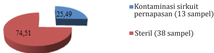
Gambar 2 Persentase Kontaminasi Bakteri pada Sirkuit Pernapasan Anestesi Setelah Digunakan pada Ruang Operasi RSHS Bandung

di dalam formulir khusus, kemudian diolah menggunakan program statistical package for the social science (SPSS) versi 21.0 for windows.