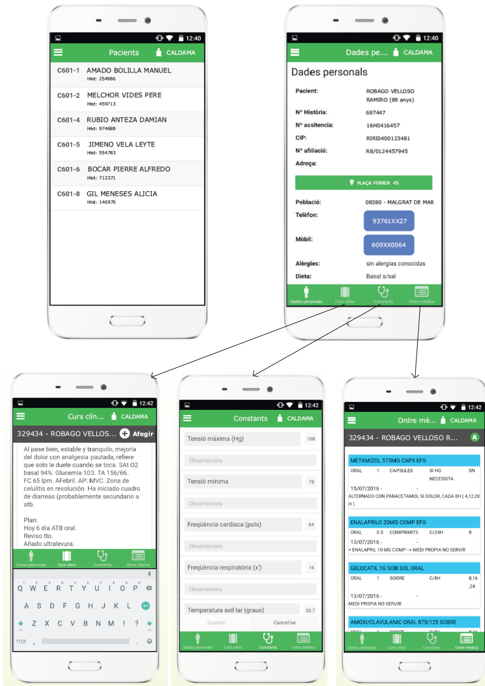
Figura 2: Principales pantallas de la App