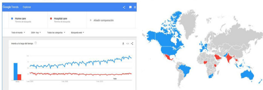
Figura 1. Resultados de las tendencias de búsqueda obtenidos en Google Trends mediante los términos "Home Care" y "Hospital Care" el 10 de mayo de 2018 y mapa, según interés de los diferentes países.

El cociente medio entre ambos términos fue de 2,85, existiendo diferencias significativas entre los valores medios ( t de Student = 51,20, gl 344, p < 0,001 ).