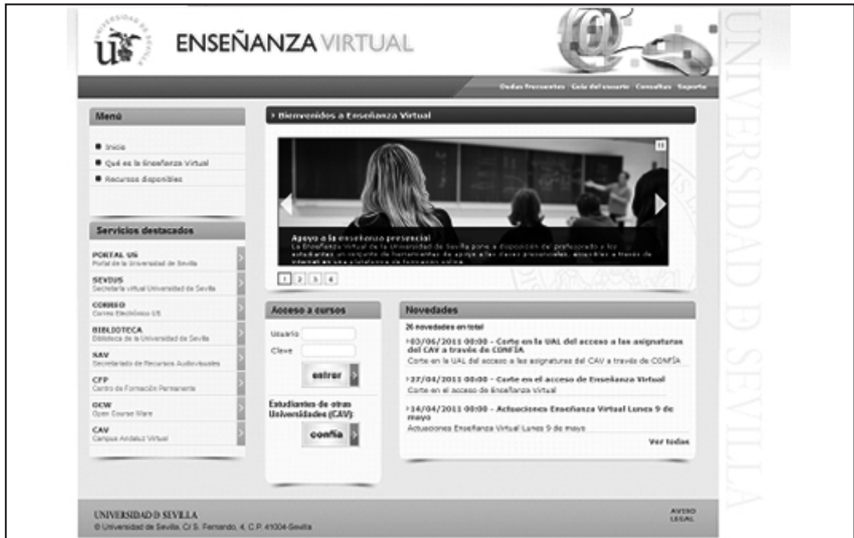
Figura 2.- Portada de la plataforma de enseñanza virtual de la Universidad de Sevilla.