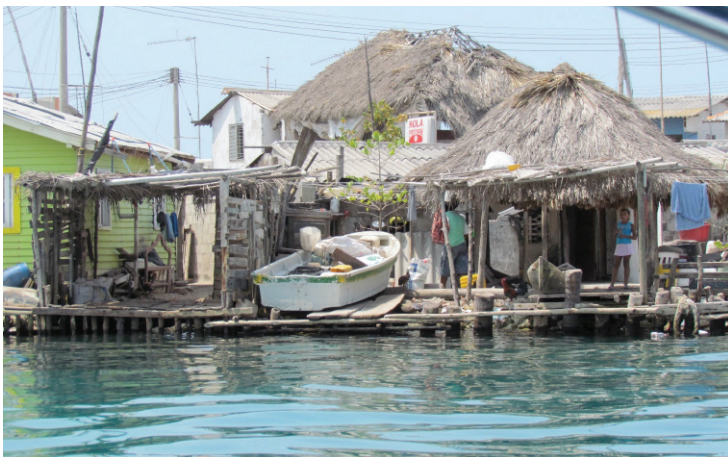
Figura 2. Islote de Santa Cruz, 2012