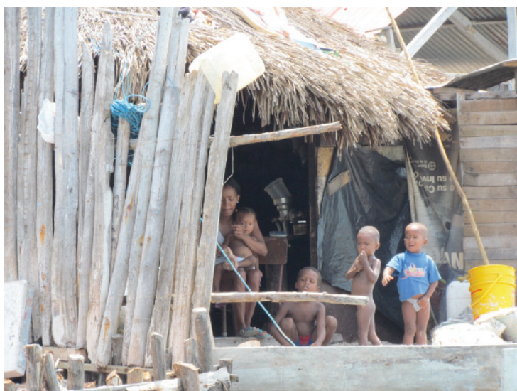
Figura 1. Islote de Santa Cruz, 2012