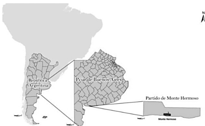
FIGURA 1: Elaboración propia en base a www.argentinaturismo.gov.ar

Monte Hermoso es un municipio ubicado sobre la costa Atlántica al sur de la Provincia de Buenos Aires, República Argentina, a 38° 59' 33" latitud sur y a 61° 15' 55" longitud oeste. Limita al sur con el océano Atlántico, al norte con el partido de Coronel Dorrego, al oeste con el partido de Coronel de Marina Leonardo Rosales. El atractivo más importante que posee Monte Hermoso es su extensa playa. Sin dudas su gran extensión, la calidez de sus aguas y la seguridad de su costa hacen