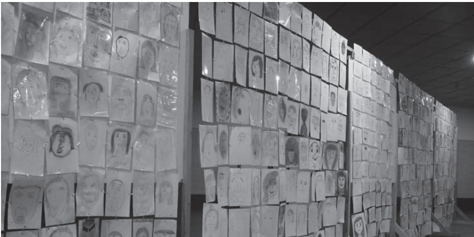
Figura 8. Los dibujos unidos por clips forman la cortina de expresiones.