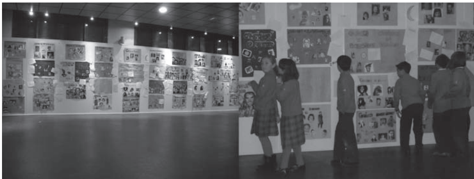
Figura 6. Los alumnos visitan sus trabajos «Catálogo de expresiones» y «Cambiamos la realidad»