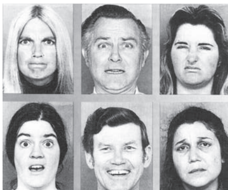
Figura A: Expresiones faciales según el psicólogo Paul Ekman.

Una de las cosas más asombrosas de estas expresiones faciales es que cualquier persona puede entenderlas independientemente del idioma que hable. Es como si se tratase de un lenguaje universal.