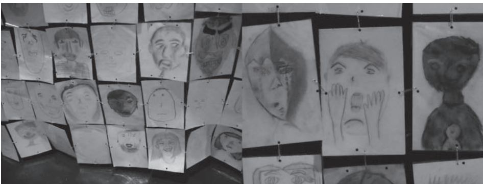
Figura 9. Podemos apreciar la variedad en los resultados finales de las pequeñas obras de arte.