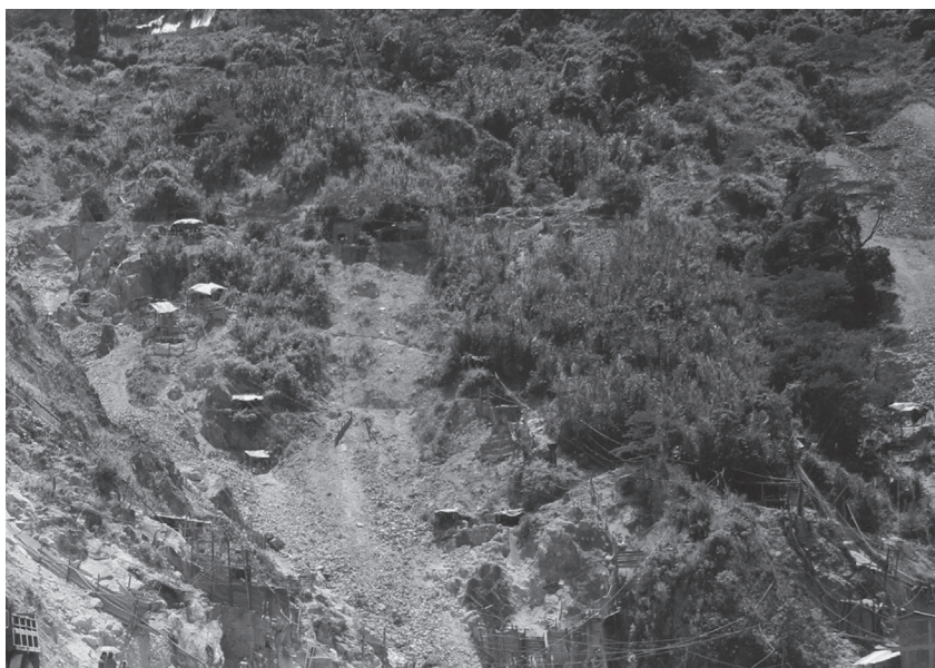
Figura 2. Vista de las bocaminas en el sector de Cien Pesos

Entre las obligaciones a las que se compromete MINERCOL figura la “negociación de un proyecto de gran minería, el cual se desarrollará en la zona alta de Marmato, donde se halla una gran concentración de pequeños mineros” (f. 322). Corpocaldas, expediente de legalización de pequeña minería en la parte alta de Marmato, rad. n.º 298.