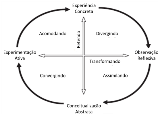
Figura 1 - Ciclo de Aprendizagem Experiencial