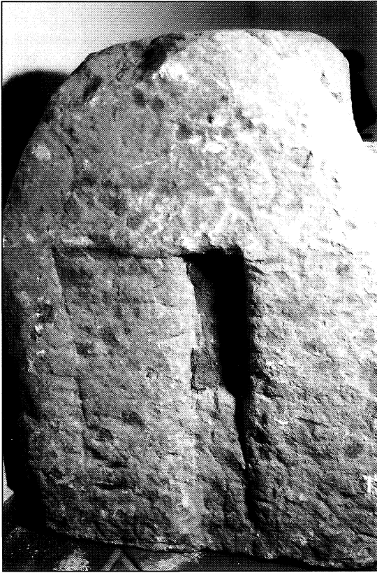
Fig. 1.—Parte trasera de la estela de Gualda.

que hubiesen topado con un desperfecto de esa índole pudiera ser el canalillo vertical, de distinta profundidad, que, por mor de cata, se grabó en el centro del área trazada y que no creemos, como sospechan los editores 3 , hubiera servido para engarzar algún tipo de material constructivo en el momento de la reutilización de la estela y menos para que fuera colgada en su primitivo emplazamiento. Más bien parece que, ante la perspectiva de tener que rebajar en varios centímetros todo el campo, optaron por dar la vuelta a la estela y utilizar como cara frontal la parte originariamente trasera, que entonces recibiría los dos campos rebajados para la inscripción y sería alisada, junto con los costados.