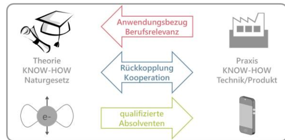
Abb. 1: Der Open MINT Labs Unique Selling Point (USP). Anwendungsbezug durch Kooperation mit Unternehmen

Gemäß den genannten Projektzielen wird Wert darauf gelegt, dass die virtuellen Labore auf die Lebenswirklichkeit der Studierenden eingehen bzw. an deren späteren Arbeitswelt anknüpfen. Deshalb versucht der Baustein „Anwendung“ des erarbeiteten didaktischen Styleguide (siehe Kapitel 5.2) die theoretischen Lerninhalte mit authentischen Anwendungsbeispielen aus dem modernen Industriealltag zu motivieren. Dies fließt in Form von Problemstellungen aus der Praxis (z.B. Auswertung, Interpretation, Bewertung von Datenmaterial) oder Aufgaben mit Projektcharakter in die virtuellen Labore ein und trägt damit dem problembasierten oder einem entdeckenden/forschenden Lernen Rechnung. Erst durch die (inter-)aktive Auseinandersetzung mit dem Lerngegenstand findet so beim Studierenden ein