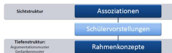
Abb. 1: Assoziationen und Rahmenkonzepte

Der Oberbegriff „Schülervorstellungen“ fasst all jene Vorkenntnisse, Vorstellungen und Vorerfahrungen zusammen, die Schülerinnen und Schüler zu einem bestimmten Lerngegenstand mitbringen. Viele der grundlegenden empirischen Studien zu Schülervorstellungen, zumindest im Bezug auf Energie, stammen aus den 1980er bis 1990er Jahren und diese setzten dabei oft unterschiedliche Schwerpunkte. Die Untersuchungen zu Schülervorstellungen über Energie, die sich auch auf den vorunterrichtlichen Bereich erstrecken, lassen sich grob in zwei Sphären unterteilen: Die Untersuchungen zu dem im deutschsprachigen Raum sehr bekannten Assoziationstest zur Energie von Duit [1] sowie verschiedene internationale Untersuchungen (in erster Linie qualitative Analysen von Schülerinterviews) zur Analyse der den Schülervorstellungen zugrunde liegenden Rahmenkonzepten [2+15+16]. Grundsätzlich untersuchen die Assoziationsanalysen dabei eher eine direkt einsehbare Sichtstruktur, während die Untersuchungen zu den Rahmenkonzepten eine Fokussierung der Tiefenstruktur der Schülervorstellungen vornehmen (siehe Abb. 1).