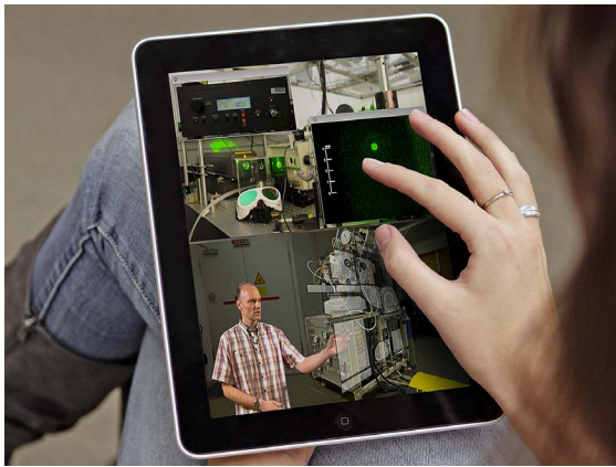
Abb. 2: Technology Enhanced Textbook (TET)

Monitor – wie im klassischen E-Learning verbreitet – wird damit überwunden.