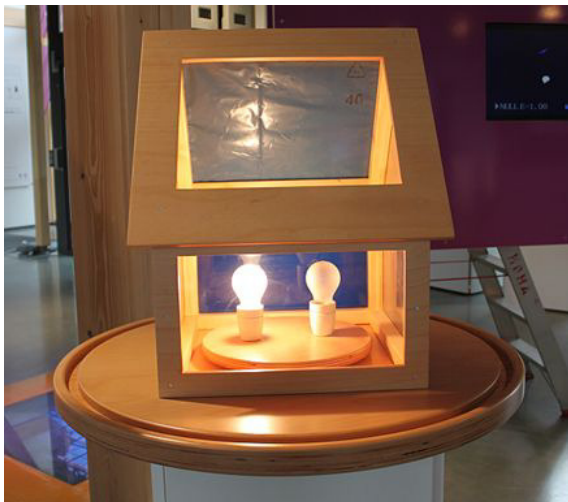
Abb.2: Das Modellhaus zur Untersuchung mit der IR-Kamera.

Bereits vorhanden war eine Station, in der der U-Wert verschiedener Wandaufbauten in einer Simulation bestimmt werden kann. Dazu wird der Wandaufbau mit unterschiedlichen Bausteinen simuliert, die anhand ihrer elektrischen Codierung die Ausgabe des Gesamt-U-Wertes auf einer Digitalanzeige ermöglichen.