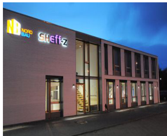
Abb. 1: Das Gebäude des SHEff-Z in Neumünster (Foto: SHEff-Z).

zelnen Teilen von Unternehmen unterstützt wird – insgesamt das Ziel einer möglichst neutralen Informationsvermittlung unterstellt werden.