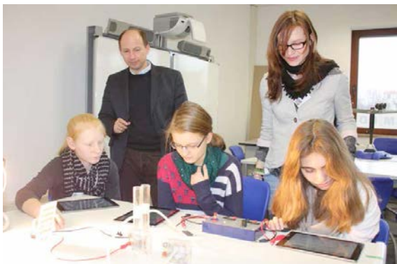
Abb.1: Schülerinnen beim Bearbeiten einer Lernstation. Im Hintergrund beobachtet der Dozent die Betreuung durch die Lehramtsstudentin

Das Seminar bietet durch die lange Auseinandersetzung mit den fachlichen und didaktischen Aspekten die Möglichkeit, sich in der Praxisphase speziell auf die pädagogischen Aspekte zu konzentrieren und diese in der gleichen Lernumgebung vier- bis fünfmal zu testen. Im Sinne der „Approximation of practice“ (Grossman, 2009) reduziert sich das komplexe Unterrichtsgeschehen durch den immer gleichen fachlichen Inhalt und methodischen Ablauf sowie durch die Betreuung der Schüler in kleinen Gruppen (drei bis fünf Schüler). Außerdem haben die Studierenden die Möglichkeit, ihr Vorgehen mehrmals zu üben oder gezielt abzuwandeln.