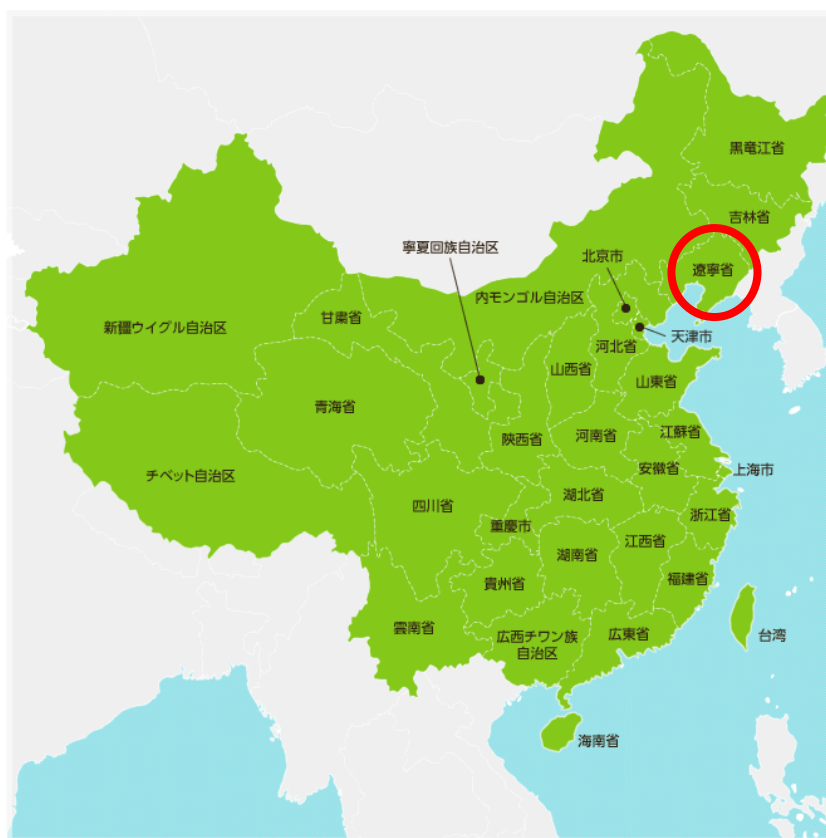
図表 1 : 中国における遼寧省の位置

遼寧省は中国東北部(黒竜江省、吉林省、遼寧省)の南部に位置している(図表1)。面積は約 14.8 万 \text{m}^2 、人口は 4,369 万人(2017 年末)である 13 。