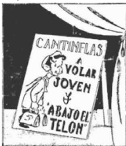
Figura No. 4. Teatro Colombia