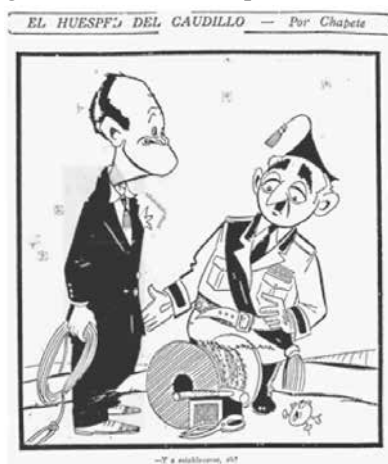
Figura No. 7. El huésped del caudillo