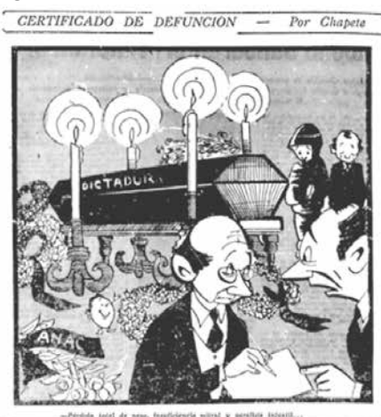
Figura No. 6. Certificado de defunción