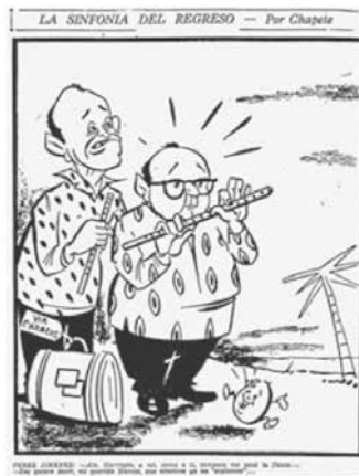
Figura No. 14. La sinfonía del regreso

Tomada de El Tiempo , Bogotá, martes 9 de septiembre de 1958, p. 4