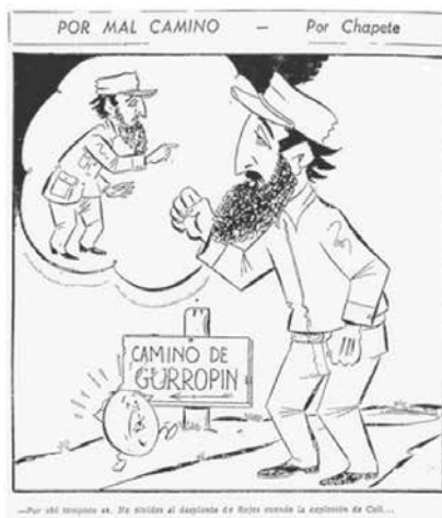
Figura No. 16. Por mal camino

El Tiempo , Bogotá, miércoles 9 de marzo de 1960, p. 4