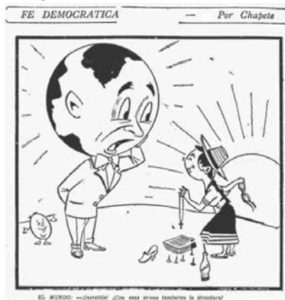
Tomada de Intermedio , Bogotá, sábado 11 de mayo de 1957, p. 4

pete' aprovecha la oportunidad que le brinda “de domingo a domingo” 13 , dedica dos de las seis viñetas a ilustrar momentos esenciales de la reciente caída del general. La que corresponde al tercer recuadro hace referencia al combate mitológico entre David y Goliat. El David en representación de los estudiantes que con la honda en la mano derecha y un libro en la izquierda enfrenta y vence al gigante Goliat, este después de asediar a los ejércitos o al país es derrotado y muere decapitado con su propia espada; en este caso al ser depuesto por el mismo pueblo que le dio el poder el 13 de junio del 53, por entre el yelmo que lleva el gigante para proteger la cabeza se reconoce claramente el rostro del dictador Rojas (figura No. 3).