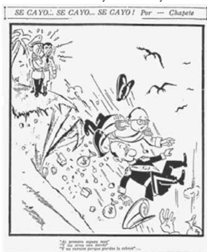
Figura No. 11. Se cayó... se cayó... se cayó!