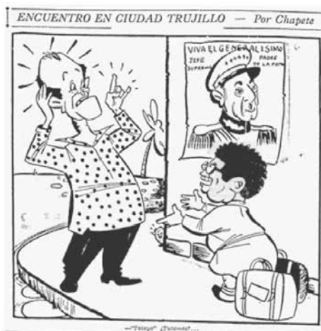
Figura No. 9. Encuentro en ciudad Trujillo