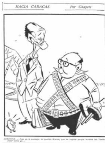
Figura No. 15. Hacia Caracas