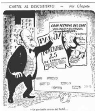
Figura No. 19. Cartel al descubierto