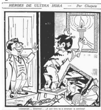
Figura No. 5. Héroes de última hora