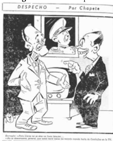
Tomada de El Tiempo , Bogotá, martes 24 de mayo de 1960, p. 4

en España. “El Jefe”, como también era conocido Trujillo, había mantenido el poder aun cuando los otros dictadores de la región ya habían caído tiempo atrás. Es precisamente la muerte del dictador dominicano el motivo para que ‘Chapete’ elabore la siguiente caricatura, en la que se identifica a Pérez Jiménez junto al general Rojas mientras leen en el periódico la noticia del asesinato de Trujillo y lamentan la partida de su “benefactor” aprovechando la circunstancia para recordar a la opinión pública la relación que unió a los dictadores latinoamericanos (figura No. 18).