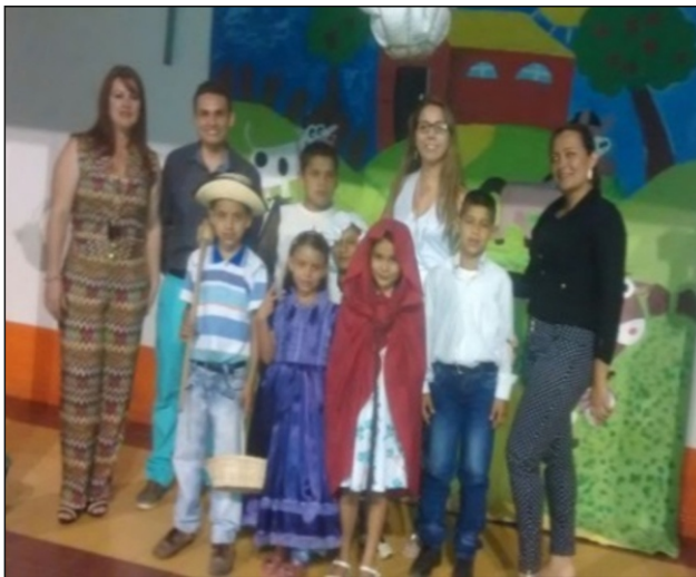
Figura 1. Estudiantes representando la obra teatral de Caperucita Roja

La descontextualización de los contenidos y el enfoque gramatical que se le imprime a la enseñanza de la lengua inglesa son causas para que el aprendizaje de las habilidades comunicativas se convierta en un proceso tedioso para los estudiantes; como se muestran en el Programa Nacional de inglés 2015-2025 Colombia Very Well (MEN, 2014). Por ende, la investigación propendió por el fortalecimiento de las habilidades comunicativas: ( Writing, Reading, Listening and Speaking ) a través de la contextualización de los contenidos en los estudiantes de cuarto y quinto grado del Centro Educativo Luchadero sede "F" Alto de la Cruz.