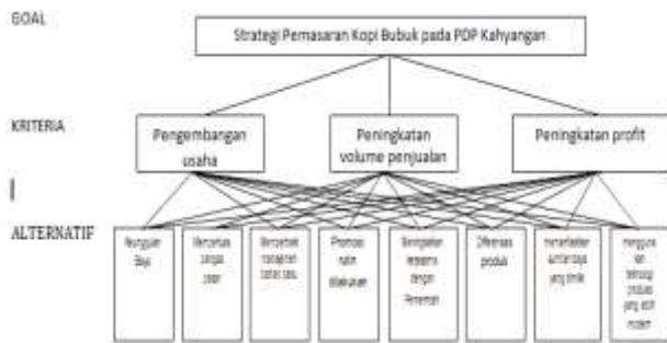
Gambar 3. Struktur Hirarki Perumusan Strategi Pemasaran pada PDP Kahyangan