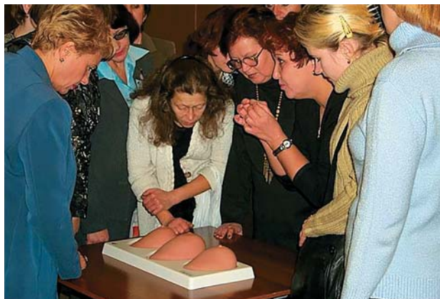
Просветительская акция для сотрудниц ОАО «Газпром» «Обследуй себя и будь здоровой» – практическое занятие (1999 г.).