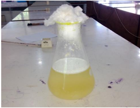
Gambar 1. Formulasi Cair Isolat Lokal B. Bassiana