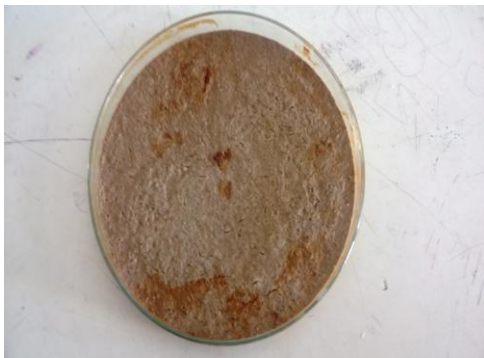
Gambar 3. Formulasi Tepung Isolat Lokal B. bassiana

Pada formulasi pasta kestabilan tidak berlangsung lama, dimana pada hari ke 5 (lima) antara padatan dan cairan tidak tercampur sempurna dan terlihat terpisah, sedangkan dari segi aroma mengeluarkan aroma yang menyengat (Gambar 2). Formulasi tepung/serbuk kestabilannya cukup baik, tetapi terjadi perubahan warna ketika proses formulasinya karena terdapat proses pengovenan yang membuat warna menjadi agak kecoklatan, sedangkan dari segi aroma tetap dan tidak mengeluarkan aroma menyengat (Gambar 3)