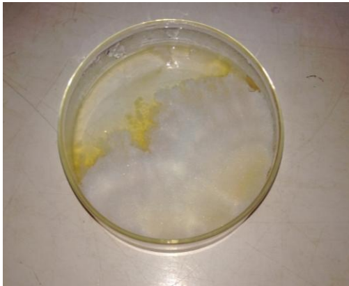
Gambar 4 Miselium B.bassiana pada Media Agar Padat