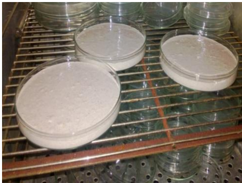
Gambar 2. Formulasi Pasta Isolat Lokal B. bassiana