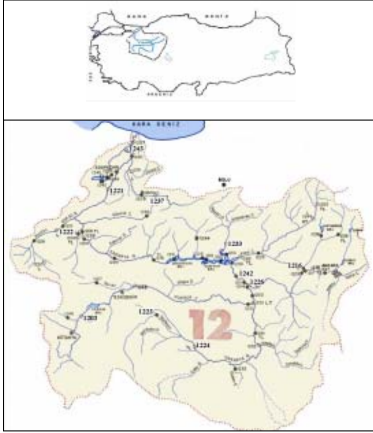
Şekil 1. Sakarya havzasının Türkiye üzerindeki yeri ve istasyonlar.