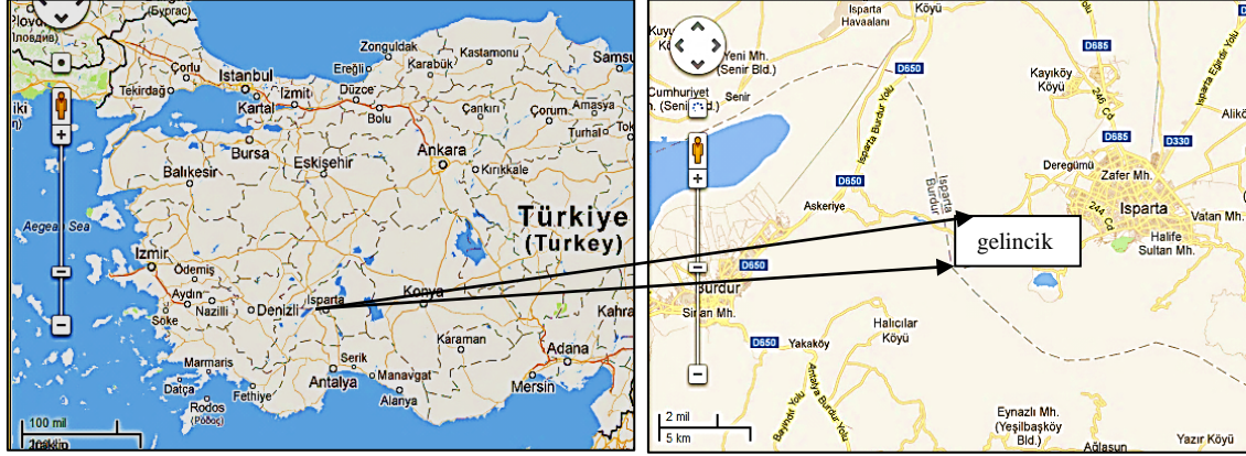
Şekil 1: Çalışma alanını gösteren harita (Location map of the study area).

nedeniyle günümüzde özellikle inşaat malzemesi olarak büyük önem kazanmıştır. Bu amaçla pomza üzerinde yoğun şekilde çalışmalar yapılmaktadır. Bu çalışmada da Isparta Gelincik köyü civarındaki pomza oluşumlarının jeolojik, mekanik ve fiziksel özelliklerinin belirlenerek hafif beton malzemesi olarak kullanılabilme özellikleri araştırılmıştır.