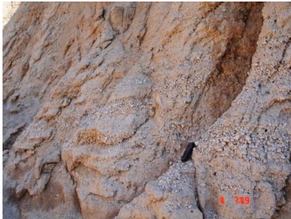
Şekil 2: Gri renkli pomza ( grey colored pumice ).

yönünden farklılık gösterir. Yöredeki pomza yatakları, Pliyosen volkanik aktivitesine bağlı olarak piroklastik kayaçların çökmesi şeklinde oluşmuştur. Yörenin yüksek kesimlerinde tuf + piroklastik kayaçları içeren formasyonların üzerinde, çok küçük bir alanda 50–100 cm. kalınlığında inşaat malzemesi yapımına uygun pomza (gri) gözlenmektedir (Şekil 2). Bölgede tekstil kalitesine sahip pomza sıklıkla tuf içerisinde yer almaktadır. Tüfler Yakaören köyünden Gelincik köyüne kadar kalın bir tabaka haline uzanır. Katman; Isparta–Gelincik–Burdur karayolu boyunca sol ve sağ kesimde rahatça izlenebilmektedir. Ancak, birim Yakaören-Gelincik hattı boyunca homojen bir yapı göstermez. Yakaören köyü girişinden itibaren katman sıkı tuf halinde olup bol traki-andezit blok ve lapillileri içermektedir. Katmanın üst taraflarına doğru bloklarda nisbeten bir azalma gözlenmektedir. Tuf katmanları yol boyunca yer yer traki-andezit daykları ile kesilmiş olup süreklilik göstermemektedir. Isparta - Gelincik – Burdur kara yolunun Yakaören-Gölcük ve Gelincik-Burdur yol ayrımından sonraki 6.-7' km. lerde yolun sağ ve sol tarafındaki tuf tepelerinde tekstil pomzası seviyeleri bulunmaktadır (Aksoy, 2010).