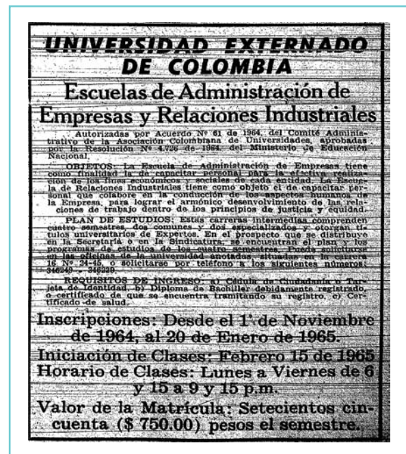
Figura 1. Aviso de prensa de la Universidad Externado de Colombia anunciando la apertura de la Escuela de Administración de Empresas y Relaciones Industriales.

En el Externado de Colombia se inició la oferta de estudios de administración en conocimientos de relaciones industriales antes de obtener autorización del Estado para ofrecer el título profesional de administrador de empresas. Por tanto, en esta Universidad se otorgó con anterioridad el título de “Experto en Relaciones Industriales” y no el de administrador de empresas.