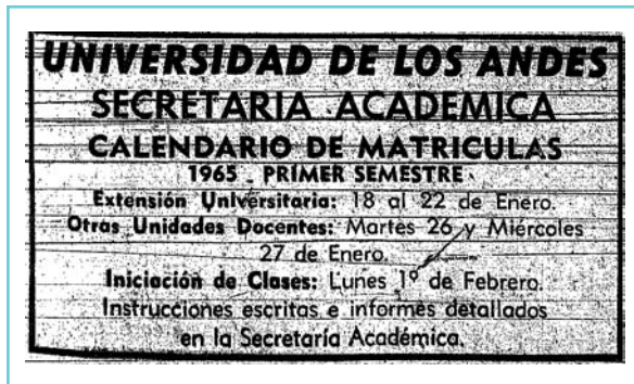
Figura 4. Aviso de prensa de la Universidad de Los Andes al inicio del Calendario Académico de 1965.

dualidad que en últimas condujo a la separación en dos facultades con carreras que empezaron a diferenciarse por el contenido de programas, asignaturas y perfiles.