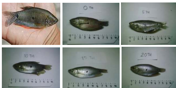
Gambar 2. Perubahan Warna Ikan Sepat

Fenotif merupakan penampakan visual suatu organisme hidup. Penampakan ini berhubungan erat dengan faktor genetik sebagai sifat bawaan dan faktor lingkungan yang mempengaruhi perubahan genetiknya. Perubahan faktor lingkungan dapat mempengaruhi perubahan genotif dan fenotip suatu organisme. Berdasarkan hasil penelitian, organisme dominan yang ditemukan di kolong pascatambang timah sebagai lokasi penelitian adalah ikan sepat rawa ( Trichogaster trichopterus ). Ikan sepat rawa bertubuh pipih dan bermoncong runcing sempit, panjang total hingga 120mm. Perak buram kebiruan atau kehijauan dengan beberapa pita miring berwarna gelap, serta bercak hitam masing-masing sebuah pada tengah sisi tubuh dan pada pangkal ekor. Namanya dalam bahasa Inggris, Three spot gourami , merujuk pada kedua bintik hitam itu, ditambah dengan mata sebagai bintik yang ketiga. Sirip ekor berlekuk (berbelah) dangkal, berbintik-bintik (Wikipedia, 2011).