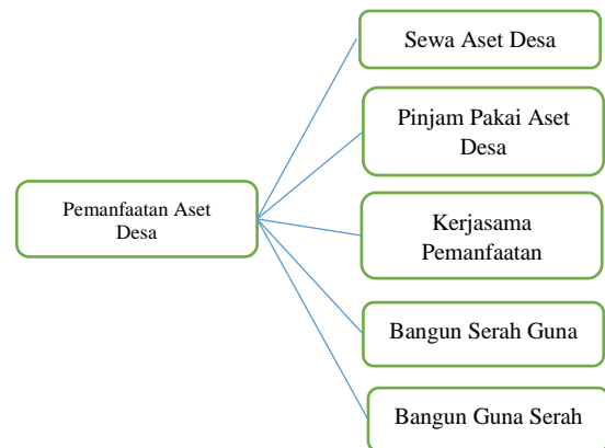
Gambar 1 Klasifikasi Pemanfaatan Aset Desa

Pemanfaatan Aset Desa adalah pendayagunaan aset Desa secara tidak langsung dipergunakan dalam rangka penyelenggaraan tugas pemerintahan desa dan tidak mengubah status kepemilikan. Skema pemanfaatan dapat digambarkan sebagai berikut :