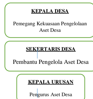
Gambar 2 Struktur Pengelola Aset Desa

Pengelolaan aset desa dalam lingkup pemerintah desa dikelola secara berjenjang yang dimulai dari kepala desa selaku Pemegang Kekuasaan Pengelolaan Aset Desa (PKPADes). Sekertaris Desa bertindak selaku Pembantu Pengelola Aset Desa (PPADes). Jenjang terakhir dari pengelolaan aset desa adalah Kepala Urusan Umum bertindak selaku pengurus aset desa. Struktur pengelolaan aset desa tergambar sesuai dengan bagan struktur dibawah ini.