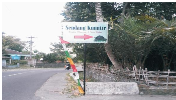
Gambar 3. Penunjuk Jalan Menuju Pesona Sendang Kumitir

jalan menuju Pesona Alam Dusun Kumitir sudah baik meski ditengah desa dan jalan menuju lokasi tersebut mudah dikenal karena petunjuk arah yang dibuat sebelum masuk ke desa tersebut.