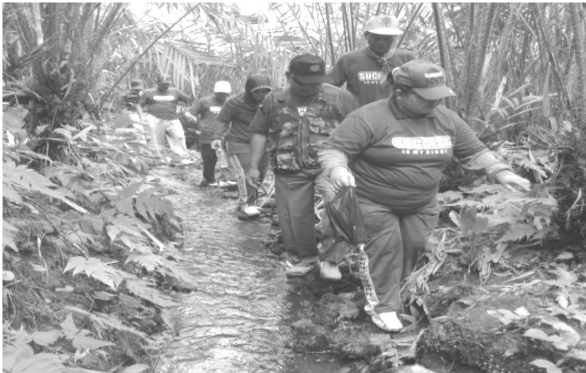
Gambar 5 Kegiatan Outbound di Sungai dan Kebun Salak Pesona Alam Sendang Kunitir.