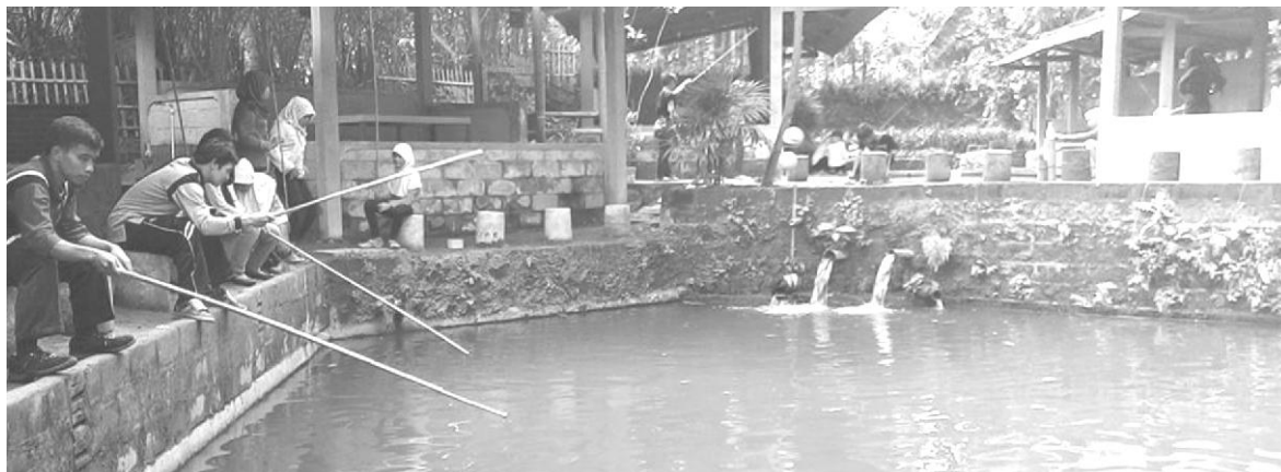
Gambar 6. Kolam Pemancingan Pesona Alam Sendang Kunitir

sekitar lokasi wisata tersebut. Kolam-kolam yang menyatu dengan kebun salak menambah keasrian lokasi wisata tersebut. Dengan mengambil ikan sendiri atau memancing para wisatawan bisa menikmati ikan untuk diolah oleh pemilik atau bisa diambilkan oleh pemilik.