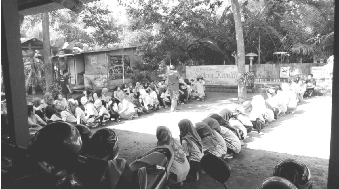
Gambar 4. Kegiatan Outbound di Halaman Pesona Alam Sendang Kunitir

Adapun fasilitas untuk mendukung kegiatan Outbound sebagai berikut :