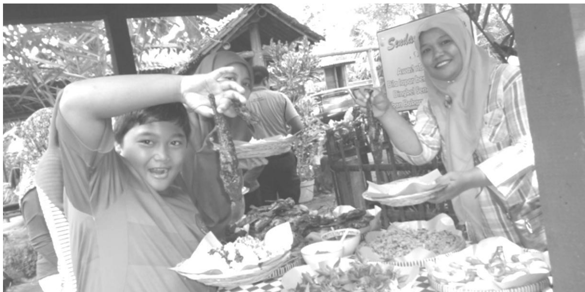
Gambar 7. Aktivitas Kulineri di Pesona Alam Sendang kunitir