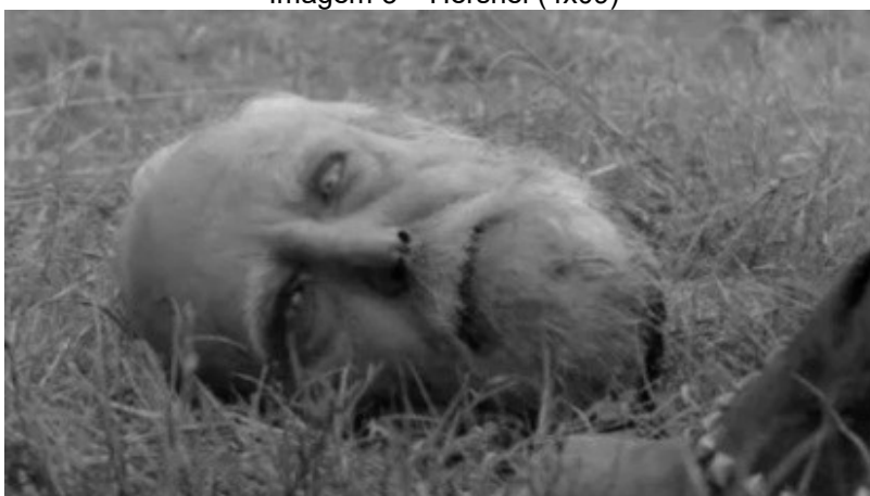
Imagem 3 – Hershel (4x09)