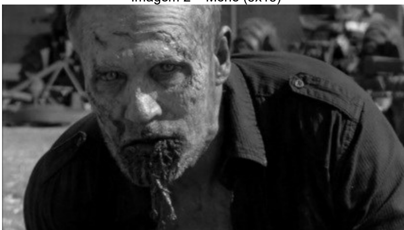
Imagem 2 – Merle (3x15)