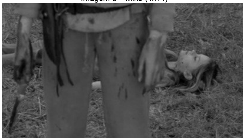
Imagem 5 – Mika (4x14)