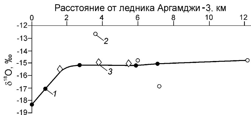
Рис. 3. Изотопный состав воды в р. Восточный Аргамджи-2 и её притоках:

1 – вода из реки; 2 – небольшие притоки; 3 – крупные притоки