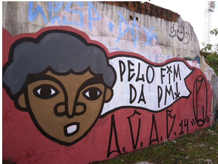
Figura 1 – Grafite “Pelo Fim da PM” realizado pelo coletivo Pinte e Lute.

Fonte: Página do Pinte e lute e acervo pessoal do autor. 13