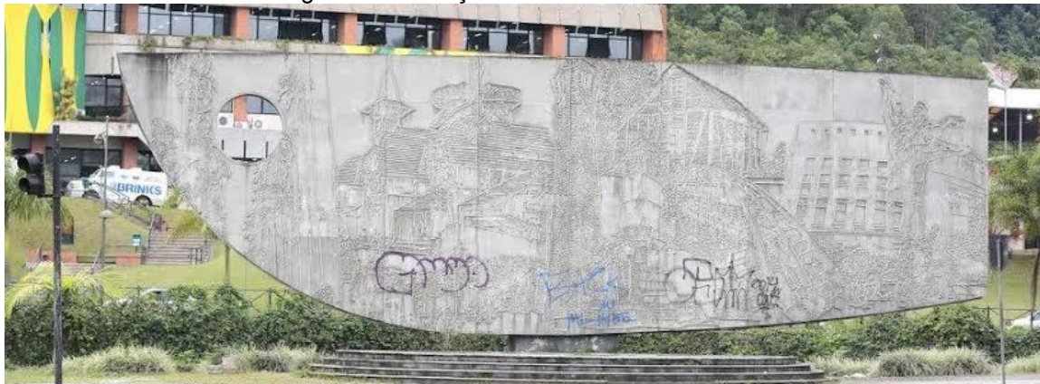
Figura 3 – Pichação no monumento “A Barca”

16