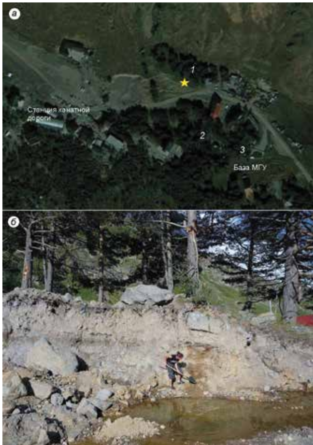
Рис. 2. Местоположение разреза в верховьях долины р. Баксан (а, обозначено звёздочкой) и общий вид разреза «Баксан» (б).

1 – сосны, растущие на поверхности склона над разрезом; 2 – сосны на старой морене возрастом более 400 лет; 3 – положение разреза с погребённой почвой в морене ледника Большой Азау