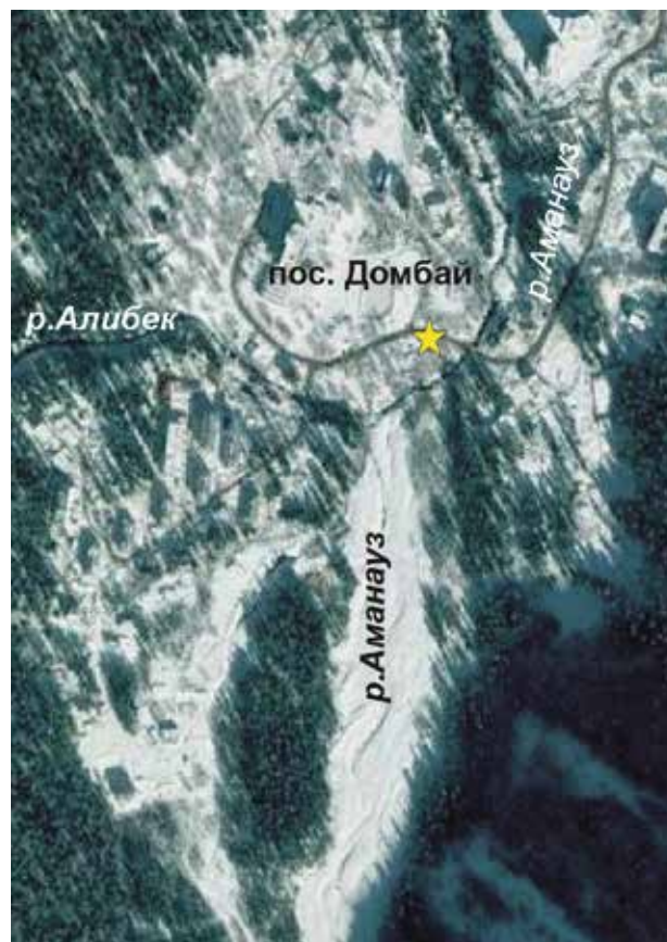
Рис. 1. Местоположение разреза в пос. Домбай (обозначено звёздочкой)

Разрез в верховьях долины р. Баксан (разрез «Баксан») проходит на левом борту поляны Азау, под склоном южной экспозиции (см. рис. 2, а). Это обнажение расположено напротив канатной дороги на абс. высоте 2340 м. Рыхлые отложения, мощностью 10–12 м, содержат обломочный материал