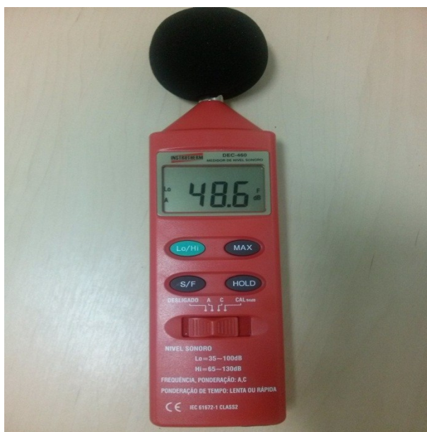
Figura 1 – Sonômetro utilizado na coleta do nível de pressão sonora.

Como o sonômetro utilizado nesta pesquisa não dispunha da função de cálculo do NPS equivalente, trabalhou-se com a técnica de avaliação valendo-se da Equação (1) com uso de planilha eletrônica para efetivação do cálculo. Em todos os períodos foram realizadas 30 leituras por dia, considerando o intervalo de 1 minuto entre cada medida. Ressalta-se que nos horários em que as leituras foram feitas não houve interferências audíveis de fenômenos da natureza, tais como chuva forte, trovões e ventos fortes, conforme recomenda a NBR 10.151/2000.