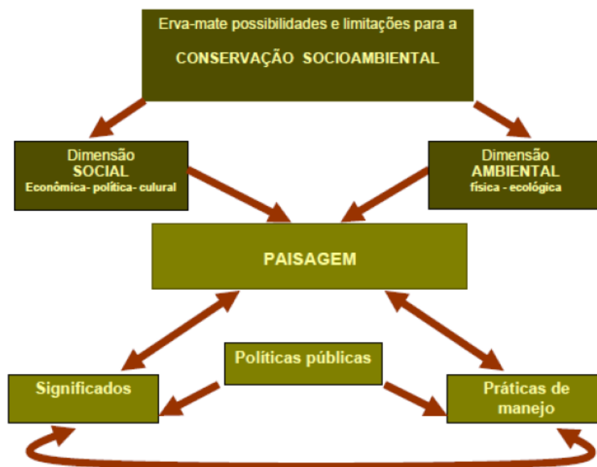
Figura 2 – Esquema síntese que mostra possibilidades e limitações de ação com vistas à conservação socioambiental em paisagens de ervais no PNC