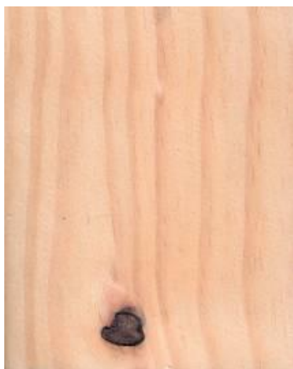
Figura 1: Lâmina boa lado A e lado B.