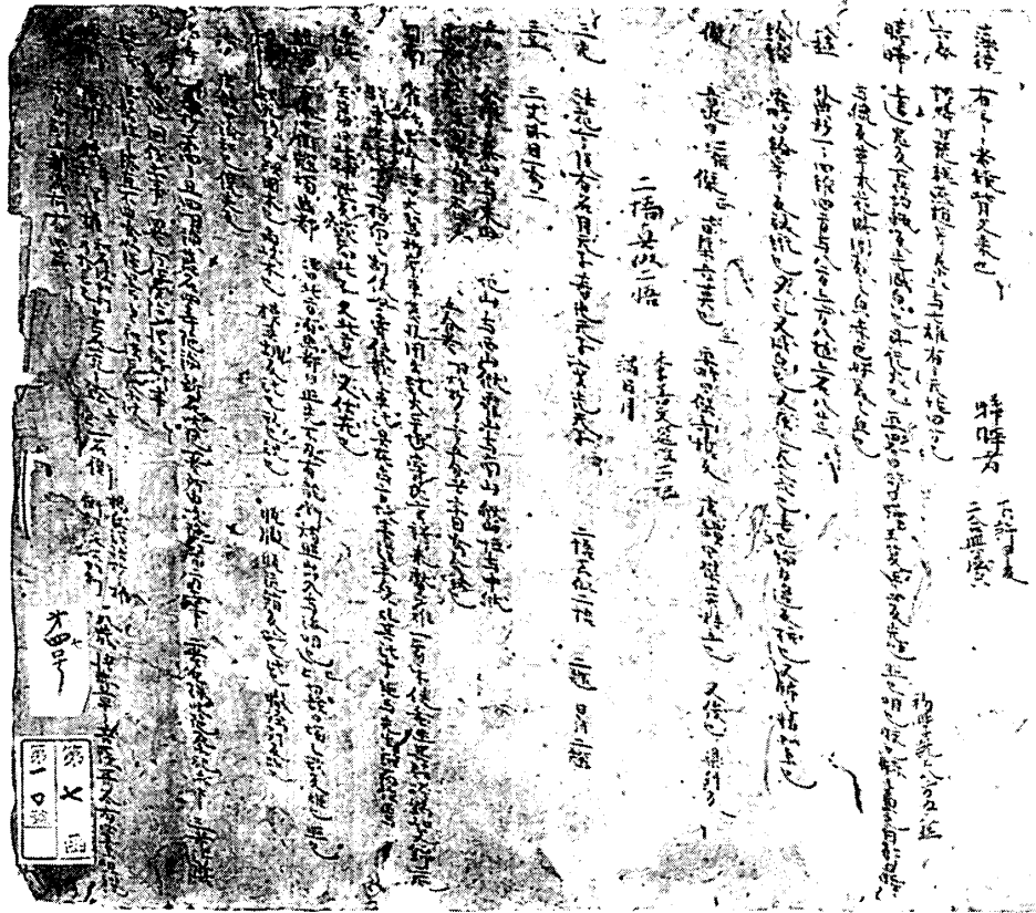
図版3 興福寺藏『因明義斷』巻頭裏書

〔裏書〕(図版3参照。各掲出字句)とに通し番号を付け、適宜改行を施した。(一)は双行注、(二)は反切等