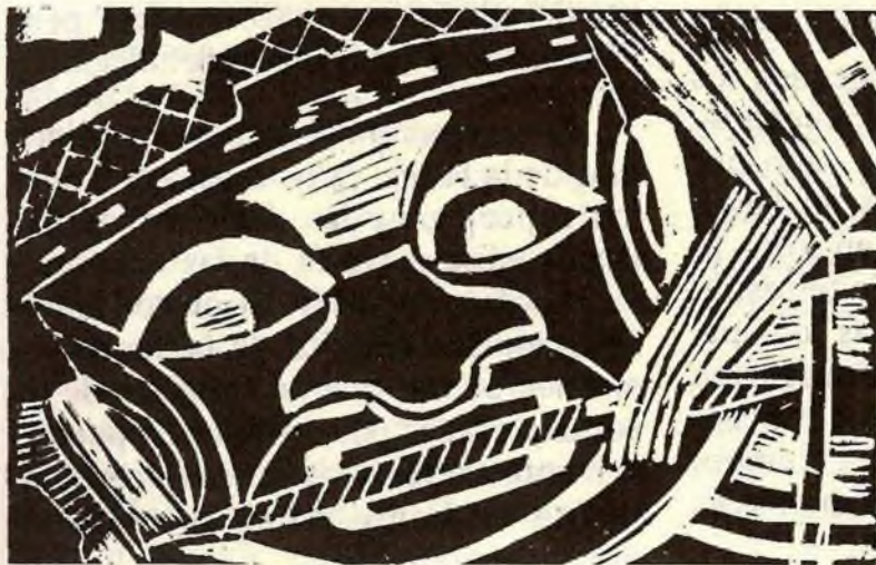
Ilustración: Rosalba Cortés Arteaga