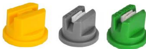
Figura 2. Bicos utilizados para realizar experimento