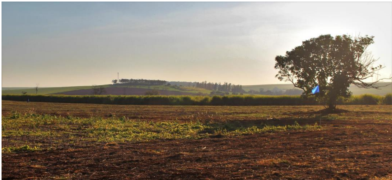
Figura 1. Um dos lados da área demarcada para o experimento.

Depois da contagem, foi verificado de maneira visual os aspectos das gotas.