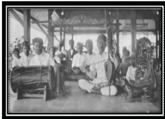
Gambar 4 Gamelan Salendro "layem" dari Tasik Malaya

Petunjuk pertama adalah pengaruh bahasa dengan varian tingkat bahasanya. Lagu gedé berasal dari tingkat bahasa sedang. Lebih tinggi daripada itu, lagu sejenis dituturkan halus dengan ungkapan Sekar Ageung (bhs. Sunda) atau Sekar Ageng (bhs. Jawa). Di tatar Sunda, gejala penghalusan bahasa tersebut terjadi bersamaan dengan mataramisasi yang meluas ke Jawa bagian barat. Diawali dari penaklukan Galuh dan dibentuknya kabupaten-kabupaten sebagai vassal Mataram, hingga dikembangkannya budaya yang berorientasi atau meniru ke Jawa atau Mataram Islam. 9