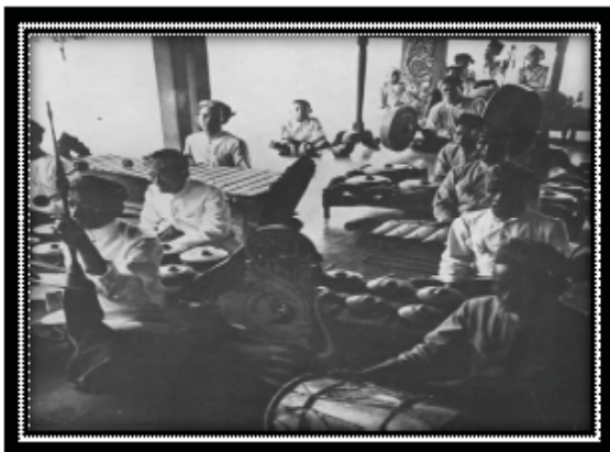
Gambar 5 Posisi pemain gamelan Salendro "layem" dari Kabupaten Tasik

Orang Jawa menyebut kliningan dengan istilah klenengan . Banyak kesamaan antara perangkat gamelan wayang dan kliningan di Sunda dengan perangkat gamelan wayang dan klenengan di Jawa. Kesamaan terjadi pada nama dan bentuk waditra (alat musik) seperti rebab , bonang , saron , demung , kenong , ketuk , kempul , goong , dan gambang . Kemudian ditemukan dalam dokumentasi Jaap Kunt, penyajian Kiliningan di Kabupaten Tasik menunjukkan masih menggunakan instrumen asli dari Jawa, terutama instrumen kendang dan rebab .