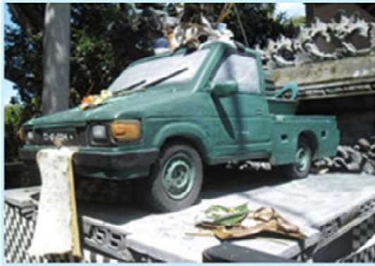
Gambar 2. Pelinggih di Pura Desa, Desa Pekraman Sangket, Kecamatan Sukasada