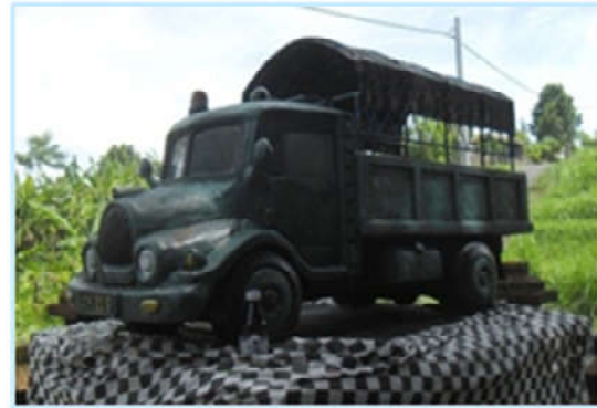
Gambar 3. Pelinggih di Pura Dalem, Desa Pekraman Sangket, Kecamatan Sukasada