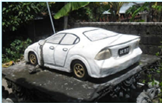
Gambar 3. Pelinggih di Pura Mangening, Desa Pekraman Sangket, Kecamatan Sukasada

kendaraan transportasi yang ‘hadir’ pada masa kini, ( gambar 1, 2 dan 3 ). Pelinggih ‘mobil’ tersebut terletak di sisi jaba (luar) areal Pura, berukuran lebih kecil dari wujud mobil aslinya. Desain semua pelinggih yang berwujud mobil tersebut dibuat detail, bahkan hampir memiliki kesamaan dengan wujud aslinya.