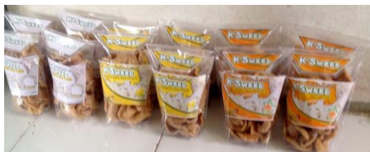
Gambar 2. Produk K'sweed (Kerupuk Rumput Laut) Aneka Rasa siap dipasarkan

Usaha kerupuk rumput laut ini dimulai pada tanggal 14 Maret 2017. Untuk proses produksi dilakukan di Jl. SMAN 2 Desa Air Putih RT/RW 003/001 Bengkulu. Keunggulan dari kerupuk rumput laut aneka rasa yaitu tanpa bahan pengawet dan pewarna dan juga mempunyai banyak manfaat positif bagi kesehatan tubuh manusia. Makanan ini biasanya dikonsumsi sebagai makanan pelengkap makan dan bisa juga untuk sekedar dikonsumsi sebagai makanan kecil (cemilan) saat sedang santai ataupun beraktifitas.