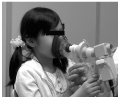
図2 マルチファンクショナルスパイロメータHI-801, 計測中