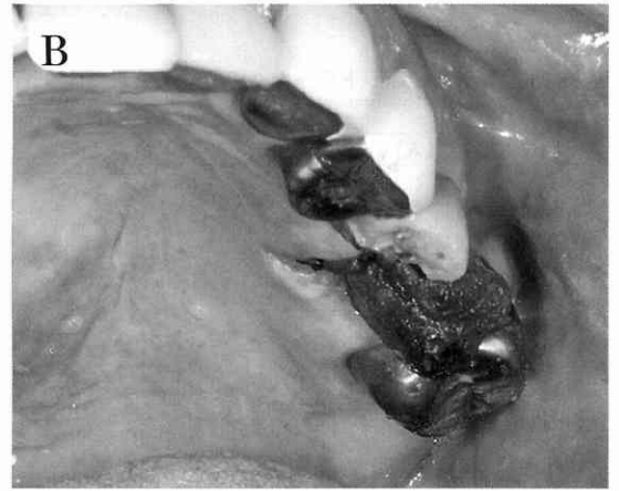
写真5 術中および術後写真 A：術中 B：術後7日目（抜糸時） 抜歯窩に著明な血餅の形成を認めた。

はみられなかったが，抜歯窩の骨は黄色を呈し骨梁は細くまばらであった（写真4）。抜歯後は止血および創部保護の目的に上下顎にシーネを装着して終術とした。術後の感染予防に対してセフジニル (CFDN) 300mg/day を3日間投与し，止血剤としてアドナ50mg トランサミン250mg を静脈内投与した。入院中，抜歯後出血は認められず，術後1日目に創部経過良好につき退院となった。術後7日目まで著明な血餅形成を認めたが持続的な出血はなく，局所感染所見もみられなかったため抜糸を行った（写真5A, B）。術後，全身的な倦怠感や疲労感はなく，肝機能低下や黄疸の悪化も認められなかった。