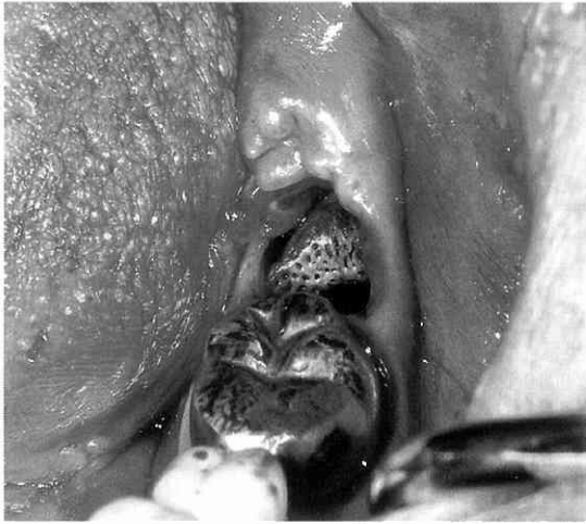
写真4 術中写真 抜歯窩の骨は黄色を呈し、骨梁は細くまばらであった。

血液検査所見：貧血および重症肝不全に伴う肝機能の低下と凝固機能の低下を認めた。HBs抗原やHCV抗体は陰性であった（表1）。