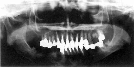
写真3 初診時パノラマX線写真 左側上顎第一大臼歯の根尖に透過像を認めた。