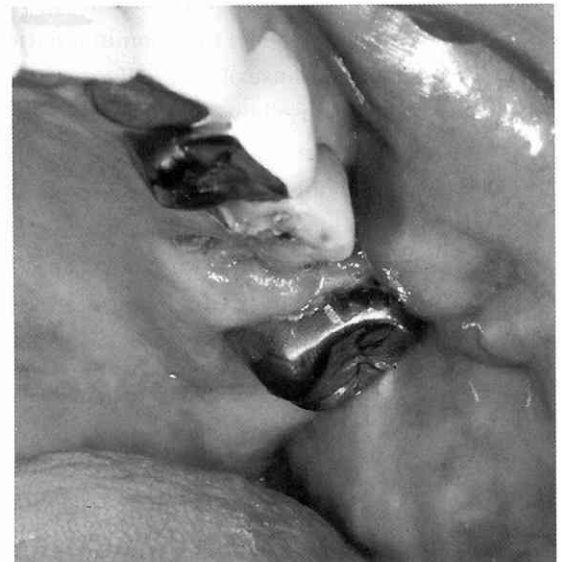
写真2 初診時口腔内写真