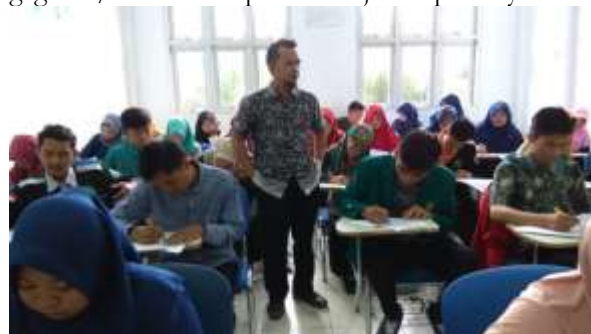
Gambar 2. Suasana mahasiswa yang sedang tes hasil belajar untuk mengetahui hasil penelitian tindakan kelas yang telah dilakukan

Pelaksanaan monitoring dilakukan bersamaan dengan pelaksanaan tindakan yakni mengamati kemampuan berfikir kritis mahasiswa saat partisipasi dalam tanya jawab, partisipasi seluruh anggota kelompok dalam melaksanakan diskusi, kemampuan mempresentasikan hasil diskusi, kemampuan dan kelancaran dalam menanggapi permasalahan/pertanyaan-pertanyaan yang diajukan saat mempresentasikan hasil diskusi, ketepatan menjawab pertanyaan, kemampuan menuangkan gagasan secara tertulis, dan keaslian gagasannya. Dalam pelaksanaan pembelajaran ternyata belum semua kelompok dapat menampilkan semua aspek seperti yang diharapkan, melainkan masih bervariasi seperti pada saat melakukan diskusi terdapat 5 kelompok yang sudah dapat bekerjasama dengan baik, aktif, tertib, sedangkan 3 kelompok masih didominasi oleh 3 orang, sedangkan 2 anggota yang lainnya belum dapat terlibat secara aktif. Pada saat mempresentasikan hasil tugas, kemampuan menyampaikan dan menanggapi pertanyaan dari kelompok lain, masih belum merata, yang menguasai dan berani menjawab rata-rata 2-3 orang, begitupun untuk aspek menuangkan gagasan/ide dan ketepatan menjawab pertanyaan.