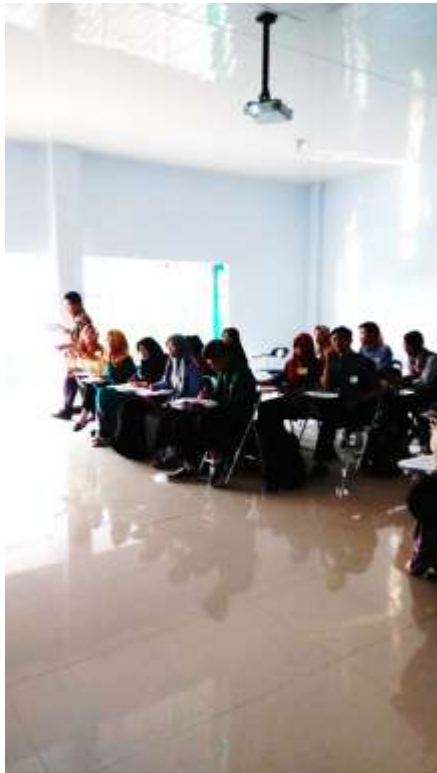
Gambar 3. Observer mengamati lembar instrument pengamatan sambil mengamati mahasiswa